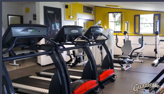
GOOD LIFE SPORT'S CLUB: Rte De Montauban, Le Gosier 97190 Guadeloupe Site pédagogique fitness