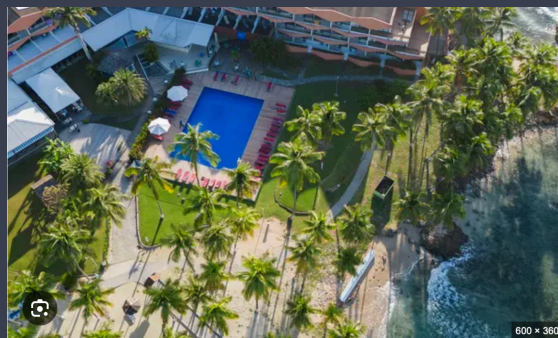
Hotel Fleur d'épée: 49 Rte du Bas du Fort, Le Gosier 97190, Guadeloupe (Site pédagogique loisirs et animation)